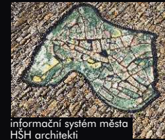
informační systém města HSH architekti