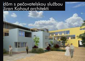
dům s pečovatelskou službou Jiřan Kohout architekti