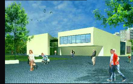
Městská knihovna_Projektíl architekti