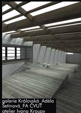
galerie Královska Adéla Setinová_FA ČVUT atelier Ivana Kroupy