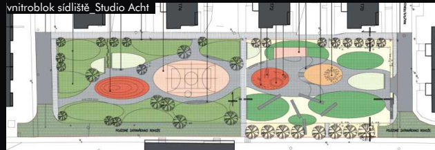
vnitroblok sídliště_Studio Acht