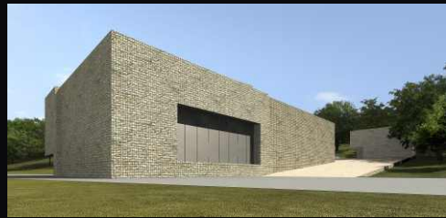
amfiteátr_Ivan Kroupa architekti