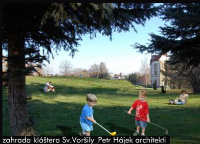
zahrada kláštera Sv.Voršily_Petr Hájek architekti