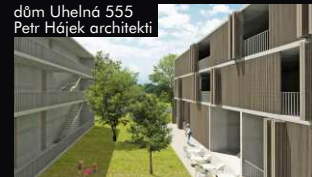
dům Uhelná 555 Petr Hájek architekti