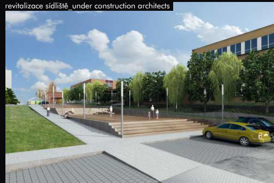
revitalizace sídliště_under construction architects