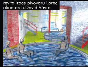
revitalizace pivovaru Lorec akad.arch.David Vávra