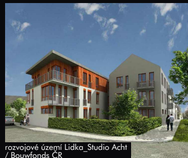
rozvojové území Lidka_Studio Acht / Bouwfonds ČR