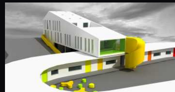
azylový dům_under construction architects